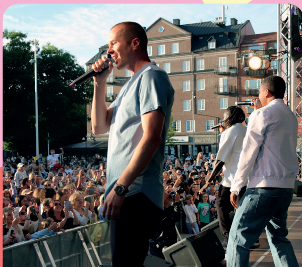
Panetoz på torget