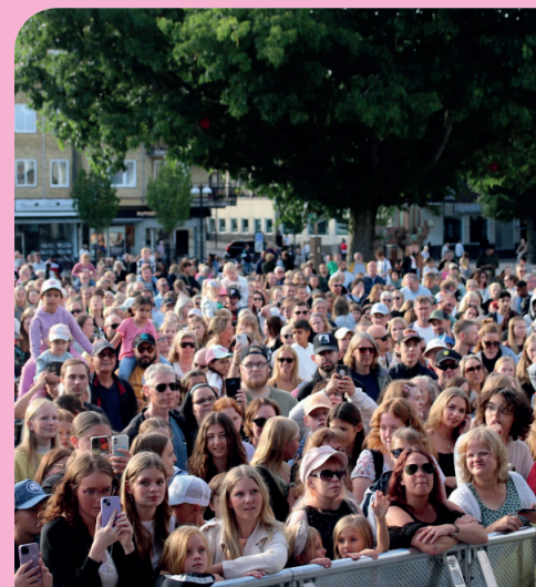
Wiktorina under en