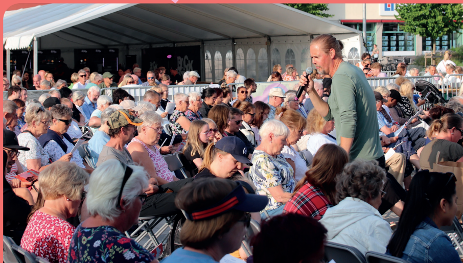
Allsång på torget