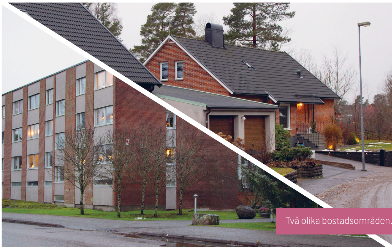
Två olika bostadsområden.

mässiga aspekterna av platsidentitet att kultiveras. Men områdets trivselmöjligheter identifieras samtidigt utifrån en avsaknad av vissa typer av interaktion med andra människor. Man anses behöva få vara sig själv och leva sitt liv utan att någon blandar sig i, och förutsättningen att helt kunna avsäga sig relationer med omgivande människor lyfts fram som en trivselfaktor.