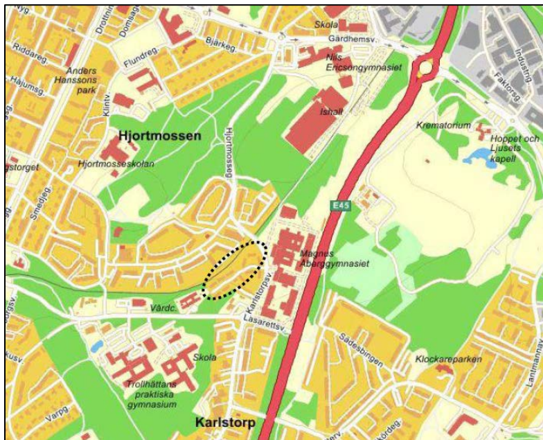
Figur 1. Översiktskarta som visar fastigheten Kuratorn 2, Karta från Eniro®

Kommunfullmäktige beslutade om planbesked den 23 oktober 2019. Som underlag till pågående och kommande detaljplanarbete, har en utredning kring parkeringssituationen i området upprättas.