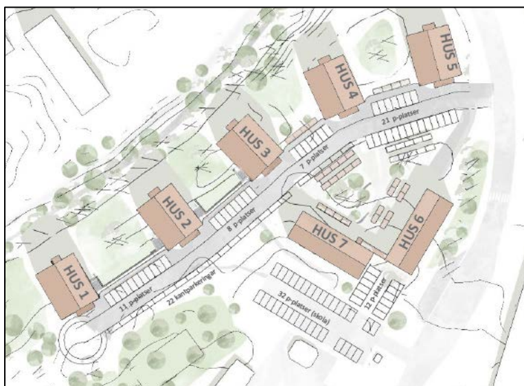
Figur 7. Antal och placering av bilparkering enligt förslag från byggherren.

I förslaget föreslås samnyttjande av parkeringsplats på Laboratorn 2 för besöksparkering till boende på Kuratorn 2. En dialog är inledd med fastighetsägaren och nuvarande hyresgäst som ställer sig positiva till möjligheten att samnyttja parkeringsplatserna. Idag används parkeringsplatserna mellan klockan 07.00 och 17.00 där tillstånd krävs. De finns totalt 32 parkeringar på denna fastighet.