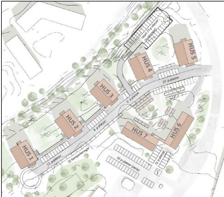
Figur 8. Vid behov av utökad p-platser om användningen av lägenheterna ändras till bostadsändamål utan inriktning till studenter. Plats för cirka 155–178 parkeringsplatser inom fastigheten med ett parkeringsdäck.