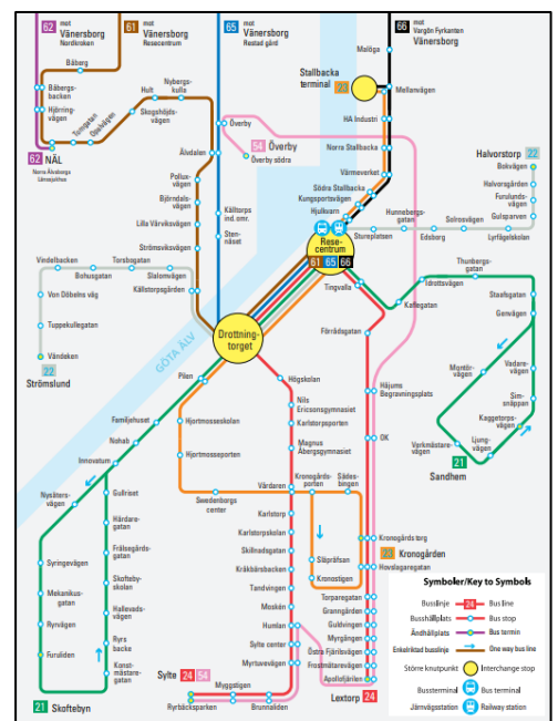
Figur 4. Linjekarta från Västtrafik

Goda bussförbindelser finns i området och busshållplatsen närmast planområdet är nämnd "Magnus Åbergsgymnasium". Den ligger i direkt anslutning till området och till resecentrum tar det cirka 7 minuter med buss. Bussens som går förbi planområdet passerar både Högskolan Väst, centrum och resecentrum längs sin rutt.