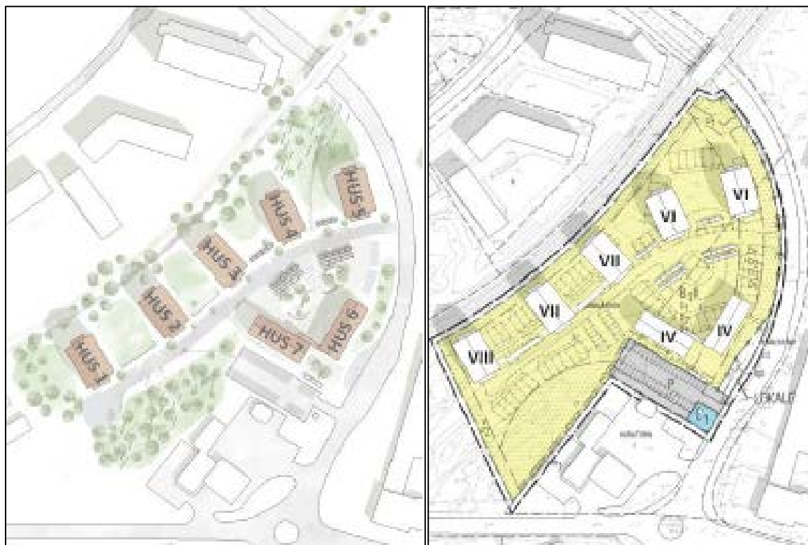
Figur 5-6. Planerad bebyggelse samt antal våningar per huskropp (IV-VIII)

Lägenhetstyperna är i detta detaljplanskede inte fastställda. Det är en preliminär bedömning om vad som är möjligt att inrymma bostadshusen med. Antal bostäder är därmed en preliminär bedömning. Fastställande av antal lägenheter och lägenhetstyper kommer att ske inför en ansökan om bygglov.